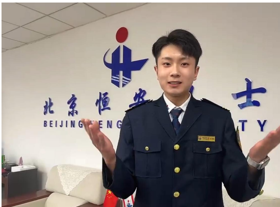
图2 学校高速铁路客运乘务专业学生在企业就业