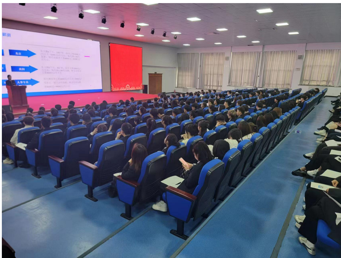
图3 召开企业宣讲会并进行专题讲座