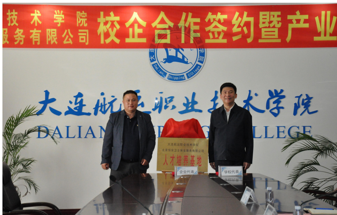
图 2 校企双方共建人才培养基地